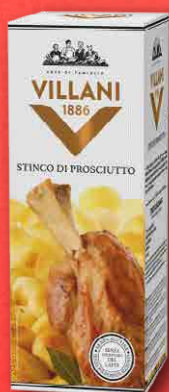
STINCO DI PROSCIUTTO AL FORNO 650 g