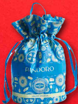
PANDORO TRADIZIONALE 750 g