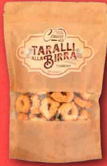
TARALLI ALLA BIRRA E SESAMO 200 g