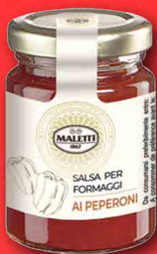
AI PEPERONI 110 g