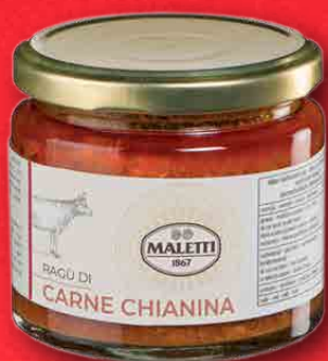
RAGÙ DI CHIANINA 180 g