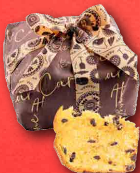
PANETTONE AL CIOCCOLATO 1 kg