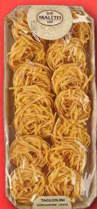
TAGLIATELLE STRETTE ALL'UOVO 250 g