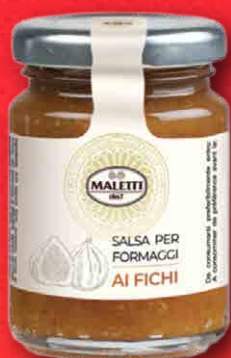
AI FICHI 110 g