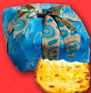
PANETTONE DI PASTICCERIA 1 kg