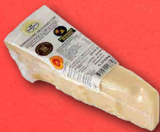
PARMIGIANO REGGIANO 18 MESI 350 g