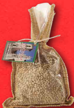
LENTICCHIE DEI MONTI SIBILLINI 250 g