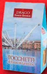
TOCCHETTI DI FOCACCIA GENOVESE 150 g