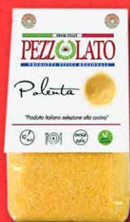
POLENTA GIALLA 300 g