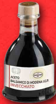
ACETO BALSAMICO IGP INVECCHIATO 0.25 Lt