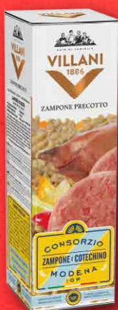
ZAMPONE PRECOTTO IGP MODENA 1 kg