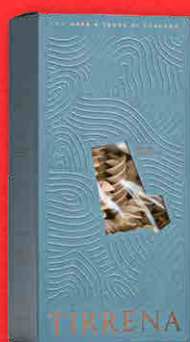
FUSILLONE GRANI ANTICHI DELLA TOSCANA 500 g