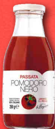
PASSATA DI POMODORO NERO 250 g