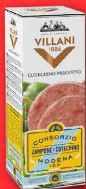
COTECHINO PRECOTTO IGP 500 g