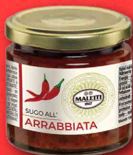
SUGO ALL'ARRABBIATA 180 g