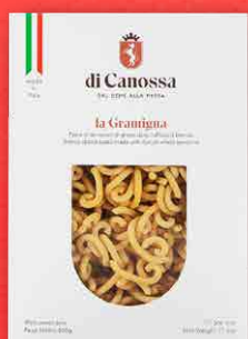
GRAMIGNA SEMI INTEGRALI 500 g