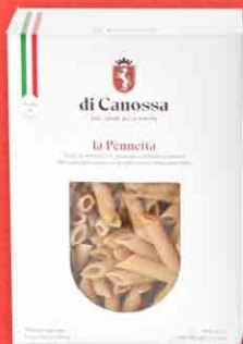
PENNETTE SEMI INTEGRALI 500 g