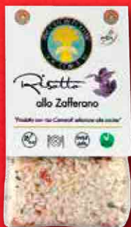
RISOTTO ALLO ZAFFERANO 300 g