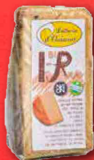
AFFINATO ALLA BIRRA 300 g