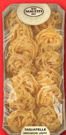
TAGLIATELLE ALL'UOVO 250 g