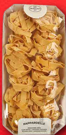
PAPPARDELLE ALL'UOVO 250 g