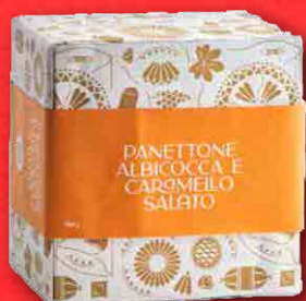
PANETTONE ALBICOCCA E CARMELLO 750 g