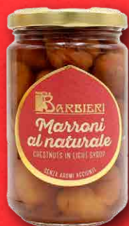
MARRONI AL NATURALE IN SCIROPPO LEGGERO 200 g