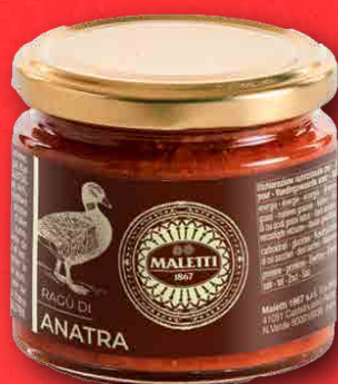
RAGÙ DI ANATRA 180 g