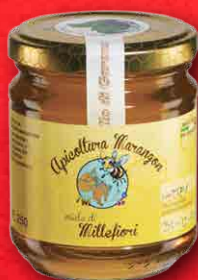
MIELE MILLEFIORI 250 g