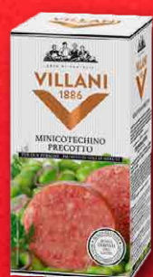
MINI COTECHINO 300 g