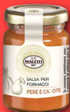
PERE E CAROTE 110 g