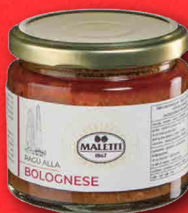
RAGÙ ALLA BOLOGNESE 180 g