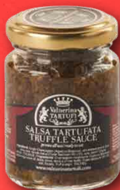
SALSA TARTUFATA 90 g