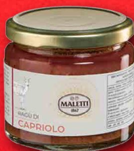
RAGÙ DI CAPRIOLO 180 g